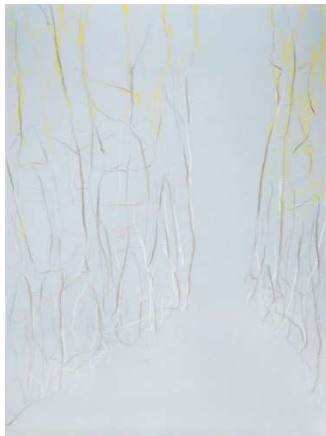
Hain, offen verwachsen

Im „Hain-offen-verwachsen“, im „Schatten“ oder zwischen den „Federstufen“ zeigt sich eine sehr intime, heiter-gelbe, schwebend-verspielte Zärtlichkeit, mit der Striche und hauchzarte Flächen